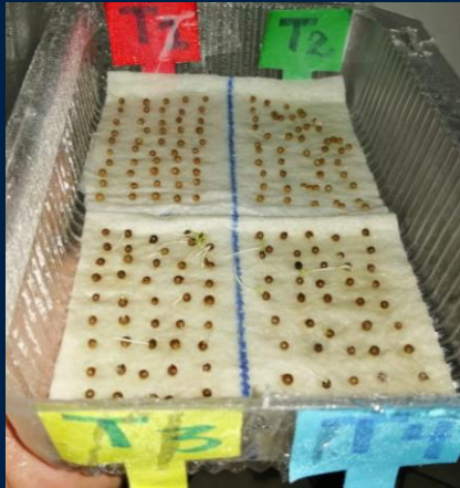
Germinación del cilantro en cámara húmeda