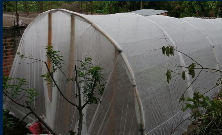
Construcción de macro túnel y preparación de suelos para los tratamientos.