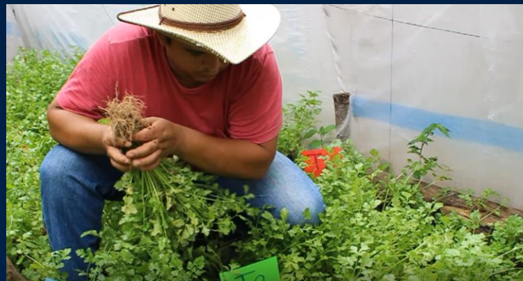
Cosecha del cilantro.