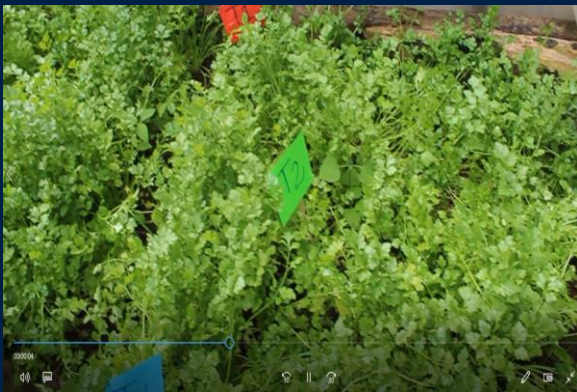
Desarrollo del cilantro