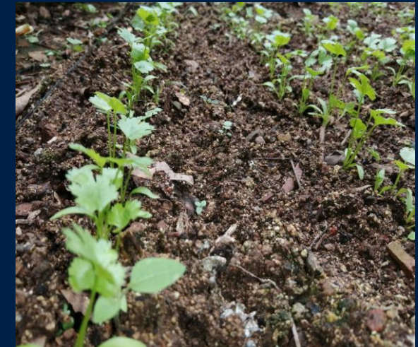
Crecimiento del cilantro a los 16 días después de siembra