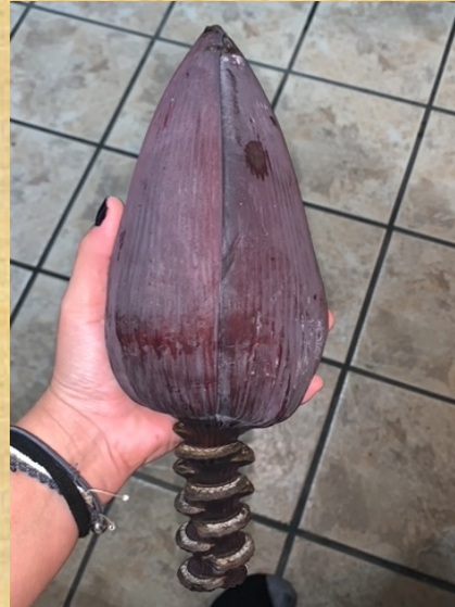
FLOR DE BANANA