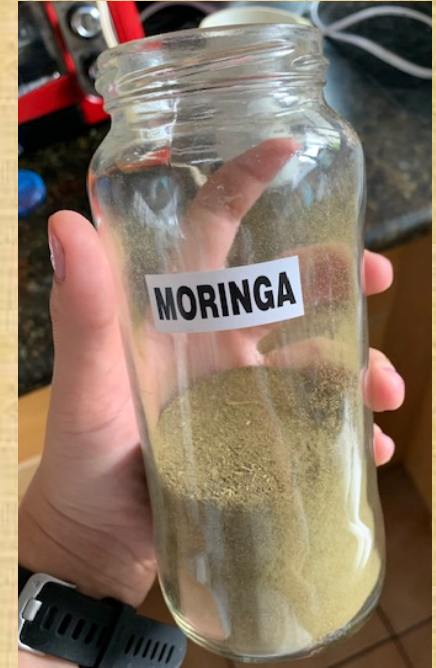
POLVO DE MORINGA